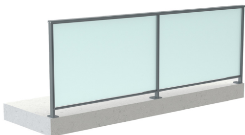
Verre 44.2 axé / Remplissage toute hauteur / Fixation à plat Montants accolés