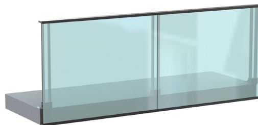
Vitro filant - Recouvrement nez de dalle Fixation à plat - Montants accolés

Garantie de sécurité optimale, design moderne et élégant ! Les lignes épurées et esthétiques du garde-corps en verre offrent à vos terrasses qualité, confort et raffinement.