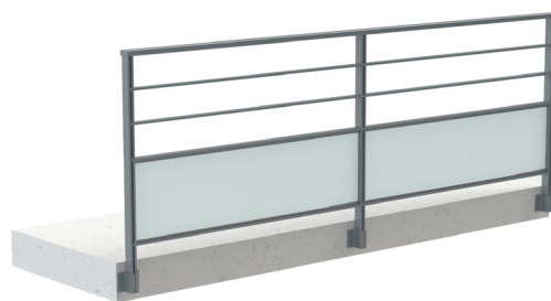
Verre 44.2 axé / 3 espaces sous main-courante / Fixation en applique Montants accolés