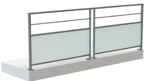
Verre 44.2 axé / 2 espaces sous main-courante / Fixation à plat Montants espacés