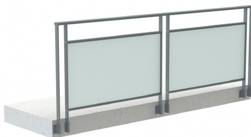
Verre 44.2 axé / 1 espace sous main-courante / Fixation en applique Montants espacés